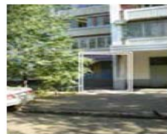
Рис. 4. Месторасположение парикмахерской

Собственнику желательно создать поток посетителей хотя бы 150 человек в неделю. Ассигнования, выделенные собственником на продвижение парикмахерской – не более 100 000 рублей. На той же улице четыре месяца назад открылась парикмахерская-конкурент на 4 посадочных места. Никаких услуг, кроме стрижки, не оказывают. Помещение крохотное, люди ждут своей очереди прямо в салоне. Работают 18-летние гастарбайтеры из Молдовы и Украины.